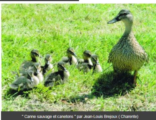
" Canne sauvage et canetons " par Jean-Louis Brejoux ( Charente)