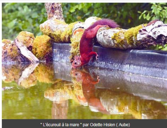
" L'écureuil à la mare " par Odette Hislen ( Aube)