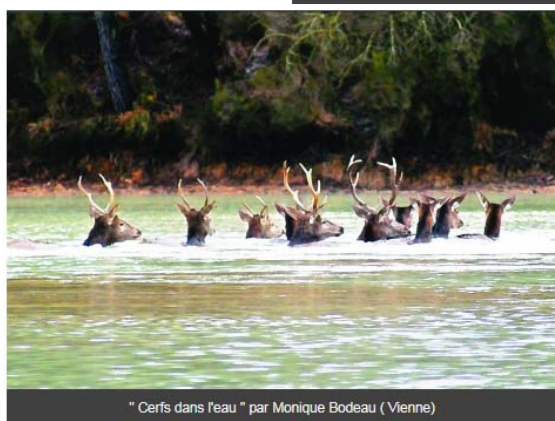
" Cerfs dans l'eau " par Monique Bodeau ( Vienne)